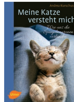
Meine Katze versteht mich

Den Hintergrund bilden dabei die Spiegelneuronensysteme im Gehirn. Auf der Basis unterschiedlicher Emotionen und Gemütsbereiche der Katzen werden ihre Wirkweise erklärt und ihre Wichtigkeit für das Lernen, Empathie und artübergreifendes Verstehen dargestellt. Neben dem Fließtext enthalten extra Info-Kästen wichtige Merksätze und warten mit Anekdoten auf. So ist dieses Buch etwas für jeden, der eine unterhaltsame und gleichzeitig informative Lektüre möchte, um sein Tier noch besser zu verstehen.